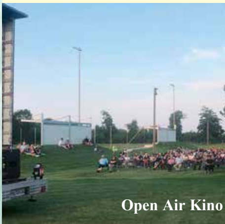
Open Air Kino