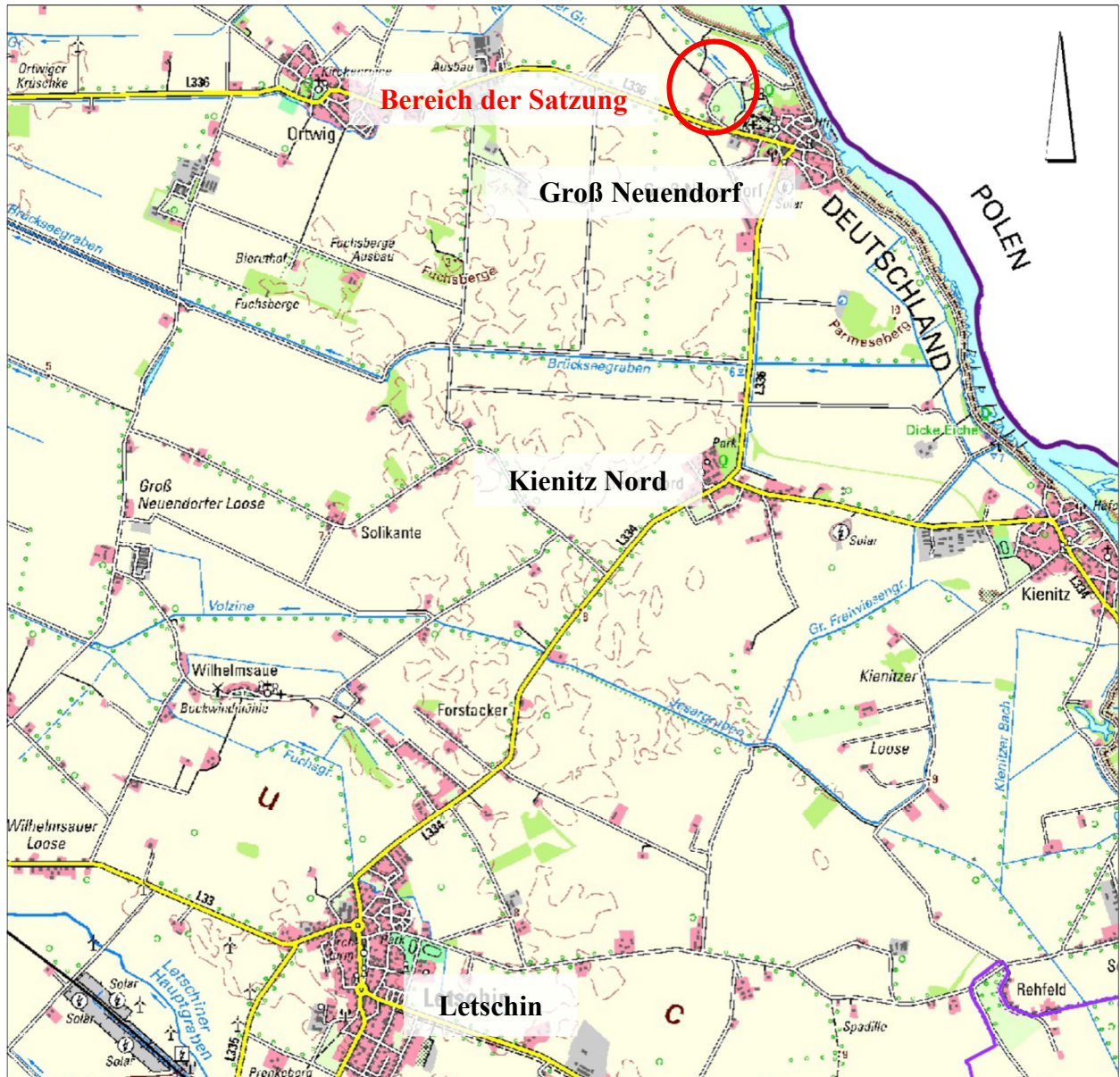
Abbildung 1: Lage des Plangebietes, unmaßstäblich, © GeoBasis-DE/LGB (2024), dl-de/by-2-0